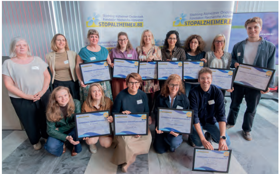
Les lauréats lors de la cérémonie de remise des subventions.

Les projets sont évalués selon plusieurs critères : leur qualité scientifique, la clarté de leur méthodologie, leur faisabilité, mais surtout leur impact concret sur la vie des personnes concernées — patients, aidants et soignants. Cette rigueur est essentielle : elle garantit que chaque euro que vous donnez contribue à des projets utiles, solides et porteurs de solutions réelles.